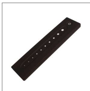
Télécommande pour kit dimmable LED2