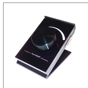
Télécommande* de table pour kit dimmable LED2