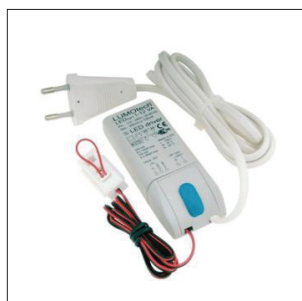
Transfo. LED1 > min 3 spots / max 8